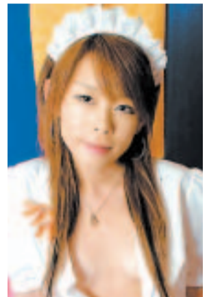
IZBOR ZA SVE UKUSE Protagonistice 'seansi' su stjuardese, učiteljice, medicinske sestre, tajnice...

pridružiti i mladenka odjevena u raskošnu vjenčanicu nakon što ih nježno opere spužvom.