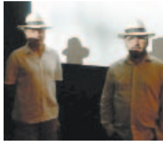
PANAMA ŠEŠIRI Bijeli šeširi cehovski su znak umjetnika

Gledamo trojicu naših umjetnika kako pred izložbu u Tel Avivu poziraju za novine u domovini. Slikari su to različiti poetika, ali zajedničko im je da imaju jednake bijele šešire na glavama, kao da su ih kupili u istoj robnoj kući, kao da se njihovo fotografiranje treba doživjeti kao konceptualni čin ili kao da su naprosto poslušali savjete meteorologa za sezonu paklenskih vrućina.